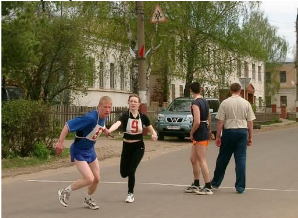
Традиционная эстафета в честь Дня Победы.

Богата и разнообразна культурная и спортивная жизнь школы. Учителя и ученики принимают самое активное участие в районных мероприятиях самого разного характера: