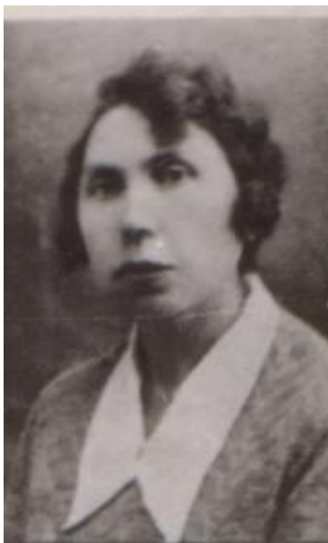
М.И.Певницкая (1934 год)