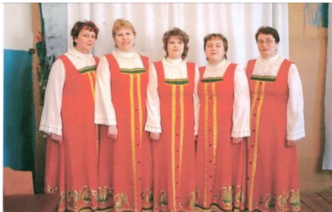
Хор «Радуница», в большинстве своём состоящий из педагогов Починковской средней школы.