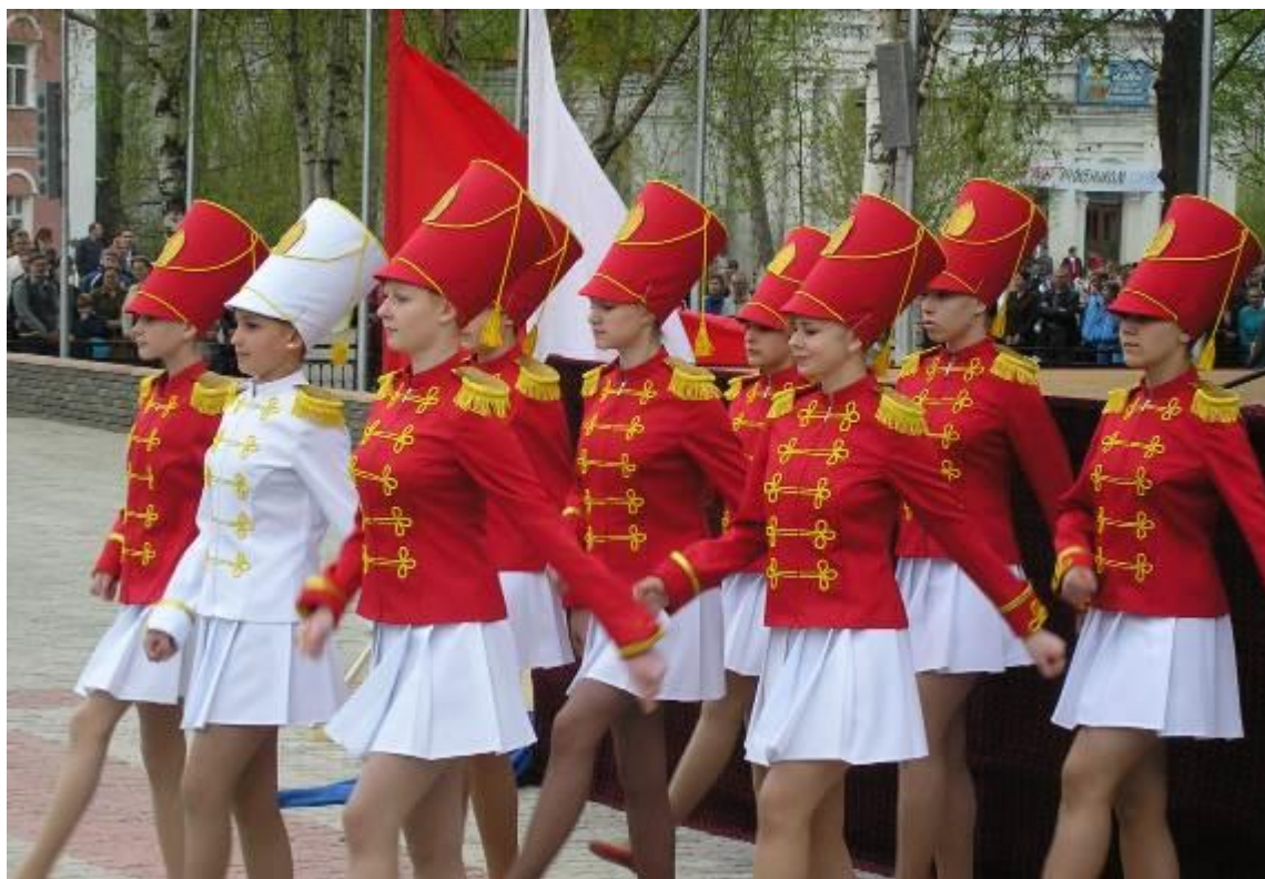
«Гусарский марш» на празднике, посвященном Дню Победы.